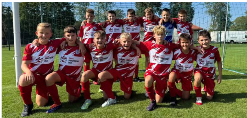
Drużyna młodzików po meczu z Magnatem Juchnowiec

Drużyny LZS Korona tej jesieni rozegrały 63 mecze i turnieje ligowe, a 31 z nich zostało rozgranizowanych i rozegranych na stadionie gminnym w Dobrzyniewie Dużym. Do tego dochodzi wiele meczów sparingowych oraz turniejów towarzyskich.