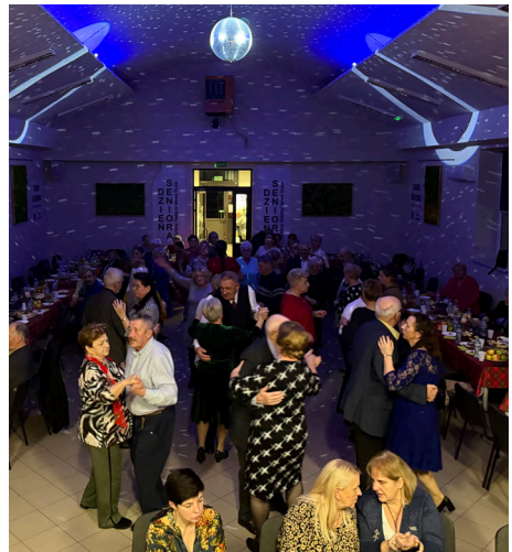
Obchody Dnia Seniora w Dobrzyniewie Dużym