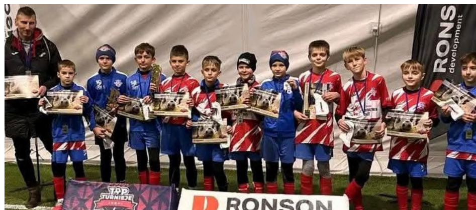
II miejsce drużyny orlików na turnieju w Książenicach k. Warszawy