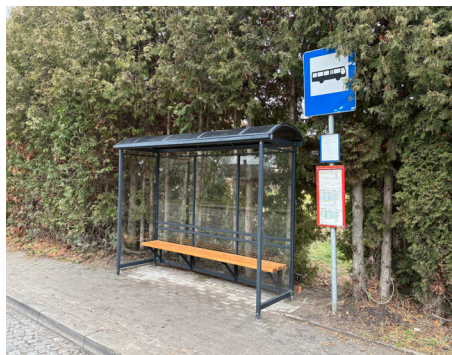
Nowe wiaty przystankowe w Dobrzyniewie Fabrycznym

i zakup wyposażenia do kuchni w GCK (lodówka, kuchenka, okap, stół roboczy); Dobrzyniewo Fabryczne – zakup i montaż 2 wiat przystankowych;