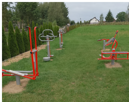
Siłownia zewnętrzna w Gniłej

Gniła – budowa siłowni zewnętrznej, doposażenie placu zabaw, zakup stołu z ławkami, wykonanie oświetlenia w świetlicy wiejskiej;