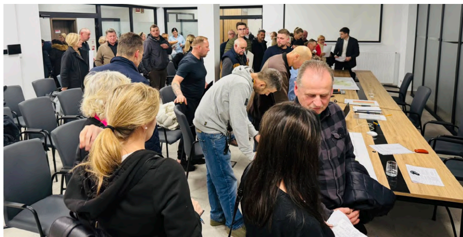
Konsultacje planu ogólnego

Plan ogólny ma zastąpić studium uwarunkowań i kierunków zagospodarowania przestrzennego. Czyli jest to taki ogólny dokument, w którym będzie wskazane 13 stref, jakie ustawodawca przyjął: strefa ogólna, strefa gospodarcza, strefa