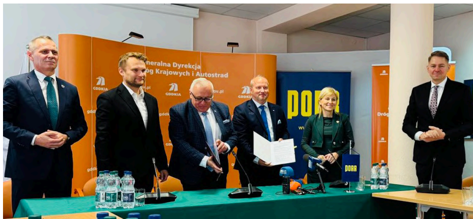
Podpisanie umowy na budowę węzła S19 Dobrzyńewo Północ.

W ostatnim roku widać Pana dużą aktywność na arenie ogólnopolskiej. Wspomniał Pan o zabiegach dotyczących węzła, ale bywa Pan też na oficjalnych uroczystościach państwowych i roboczych spotka-