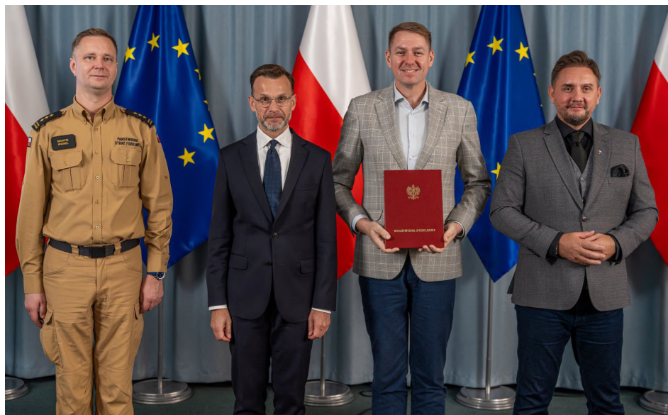
Gmina Dobrzyniewo Duże otrzymała środki finansowe z Programu Ochrony Ludności i Obrony Cywilnej,