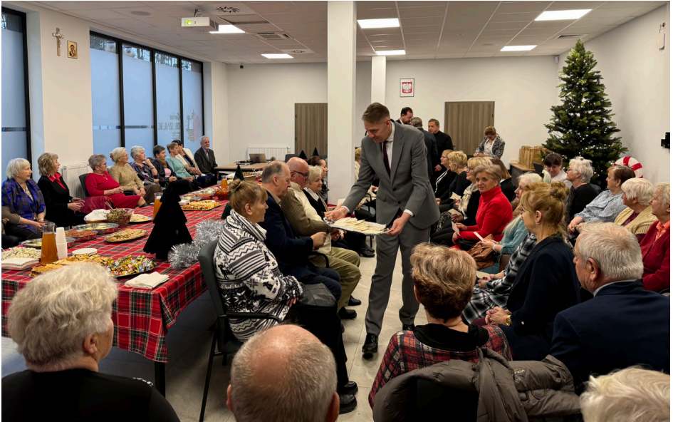
Wigilijne spotkanie seniorów gminy Dobrzyniewo Duże

szenie bezpieczeństwa, samodzielności oraz poprawę jakości życia osób starszych, uwzględniając potrzeby seniorów, ich opiekunów i służb ratunkowych.