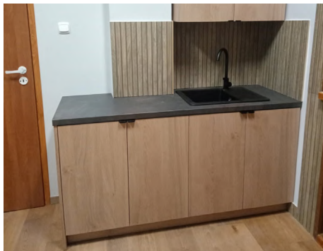
Świetlica w Kozińcach

Jaworówka – zakup altany do samodzielnego montażu przez mieszkańców sołectwa;