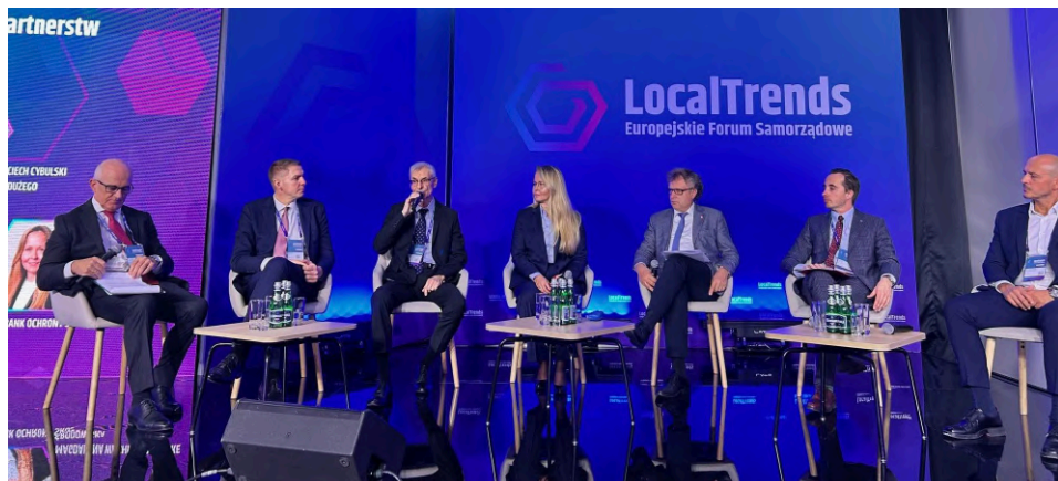
Wojciech Cybulski ma Forum Samorządowym w Poznaniu