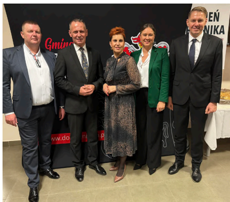
Dzień Rolnika w gminie Dobrzyńewo Duże

są naszą wizytówką. Widać ich ogromne zaangażowanie, z miesiąca na miesiąc coraz większe.