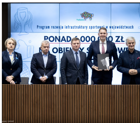
Przyznanie dotacji na infrastrukturę sportową

Najdłuższą inwestycją będą tereny rekreacyjne w Dobrzyńewie Fabrycznym.