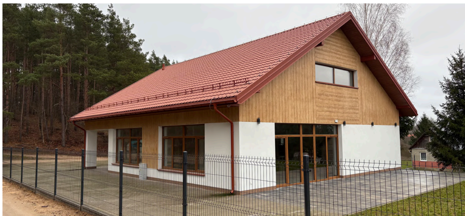
Ogrodzenie świetlicy w Leńcach