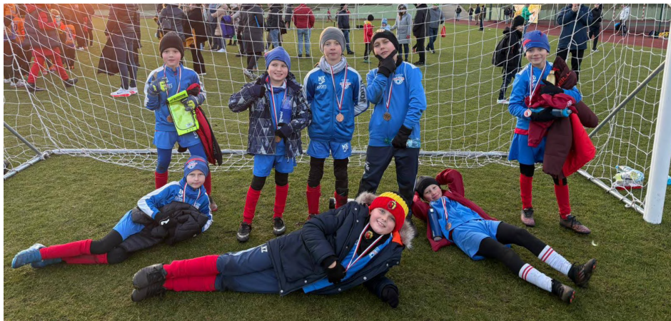
Drużyna żaków na turnieju w Tykocinie

turnieje i mecze towarzyskie, a w Dobrzyniewie seria turniejów halowych dla dzieci i młodzieży, które co roku od kilku lat organizuje nasz klub KORONA CUP 2026.