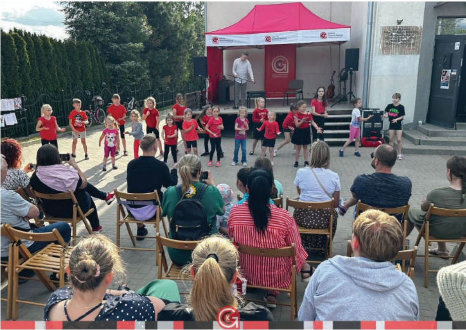
Na zdjęciach: uroczyste zakończenie sezonu artystycznego 2024/2025 w Gminnym Centrum Kultury w Dobrzyniewie Dużym