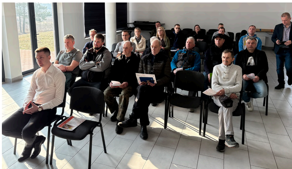
Spotkanie z mieszkańcami ws. drogi ekspresowej

miastowej wykonalności, która uprawnia do faktycznego objęcia nieruchomości w posiadanie przez zarządcę drogi oraz do rozpoczęcia robót budowlanych. 11 marca odbyło się spotkanie z mieszkańcami, na którym omówiono kwestię wydania nieruchomości i wypłaty odszkodowań.