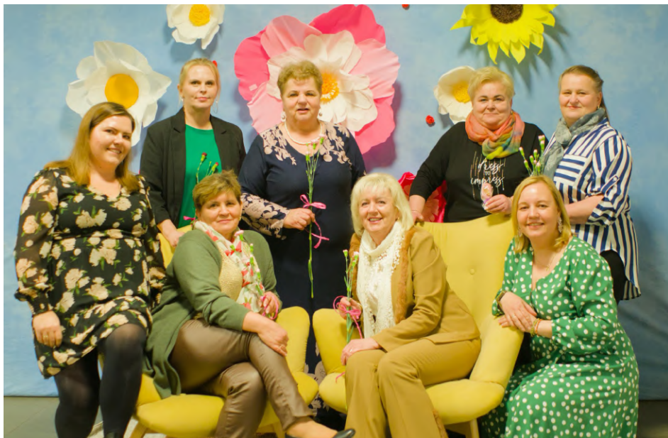
Dzień Kobiet w Pogorzałkach.

Umieść zdjęcie z naszej gminy w „Głosie Dobrzyńiewa”! Fotografie można przesyłać na adres glos@dobrzyńiewo.pl .