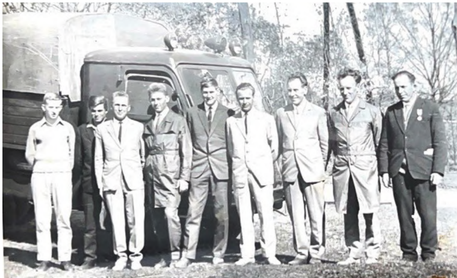
Przekazanie samochodu marki Star dla OSP Pogorzałki. 1963 r.

w Białymstoku przekazuje jednostce OSP Pogorzałki samochód STAR 20 skrzyniowy (był to pierwszy samochód strażacki na terenie gminy) oraz nową motopompę M8/8. Przekazano też ok. 1000 m węży tłocznych,