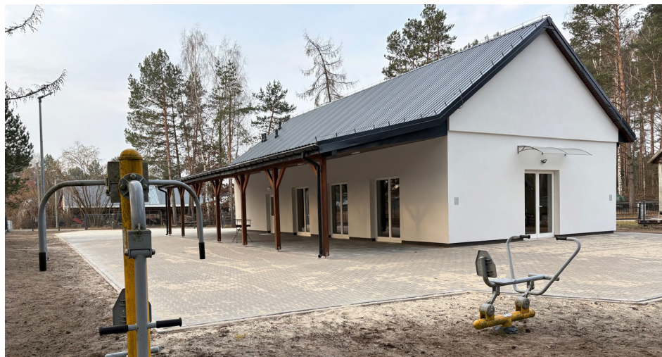
Nowa świetlica w Kulikówce i zagospodarowany teren wokół

Całkowita wartość zadania opiewa na 749 tys. zł. W całości pokryły je środki własne Gminy.