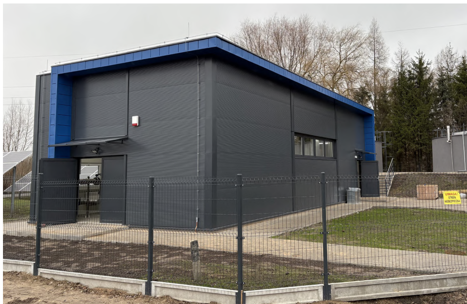
Nowa stacja uzdatniania wody w Fastach

W pierwszym kwartale 2026 r. usuwano na bieżąco awarie na wodociągach przy użyciu nowego sprzętu, zakupionego z Programu Ochrony Ludności i Obrony Cywilnej na lata 2025-2026.