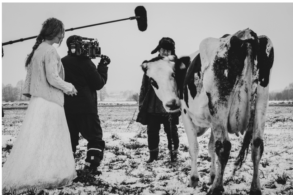
Plan filmu „Kołtunica”