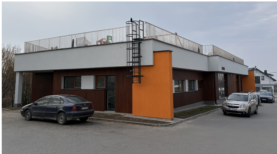
Na najmłodszych mieszkańców gminy Dobrzyniewo Duże czeka nowoczesny żłobek

Wartość inwestycji wynosi blisko 6,03 mln zł. Jest ona możliwa dzięki uzyskanemu dofinansowaniu ze środków Unii Europejskiej – NextGenerationEU w ramach programu „MALUCH+” 2022-2029 w kwocie 2,97 mln zł.