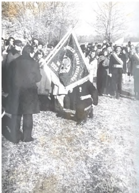
Przekazanie sztandaru dla OSP Pogorzałki