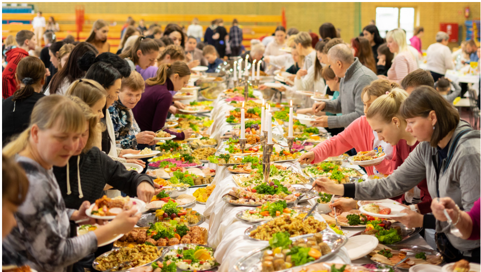
Śniadanie wielkanocne organizowane przez Fundację Rodziny Czarneckich