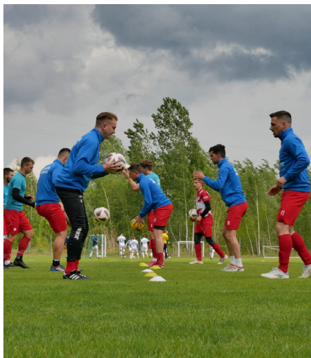
Drużyna seniorów podczas rozgrzewki przed meczem ligowym z GKS 1984 Rutki

Nasz klub przy wsparciu Gminnej Komisji Rozwiązywania Problemów Alkoholowych 6 czerwca zorganizował Dzień Dziecka z LZS Korona Dobrzyniewo Duże. Ponad trzy godziny wspaniałej zabawy na świeżym powietrzu. Dmuchańce, festiwal gier, maty celności, mecz rodzice kontra trenerzy i wspaniały poczęstunek przygotowany przez rodziców naszych zawodników — to wszystko działo się na