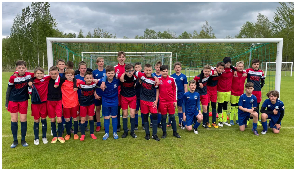
Drużyna młodzików po meczu z Wigrami

Przewodniczący Zarządu GZ LZS w Dobrzyniewie Dużym