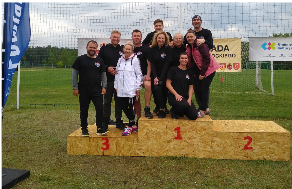
Reprezentacja gminy Dobrzyńewo Duże podczas Spartakiady