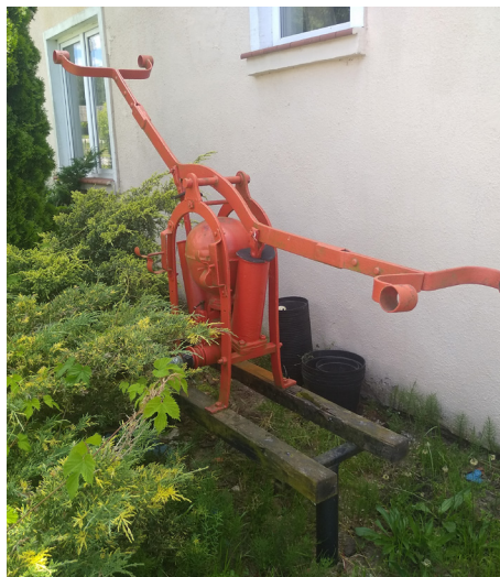
Stare sprzęty OSP Kozińce

5 grudnia 1974 r., wg protokołu walnego zebrania członków OSP Kozińce, liczba członków OSP liczyła 30, na zebraniu było obecnych 18. Wybrano za-