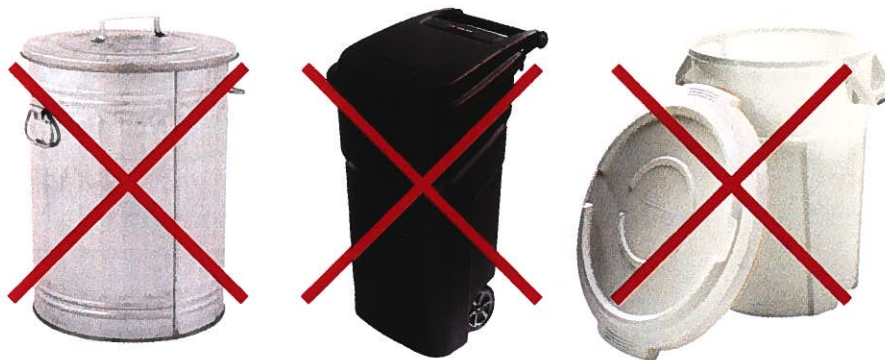
Rys. 1. Przykładowe pojemniki, które nie nadają się do odbioru odpadów komunalnych i nie spełniają wymagań polskich norm.