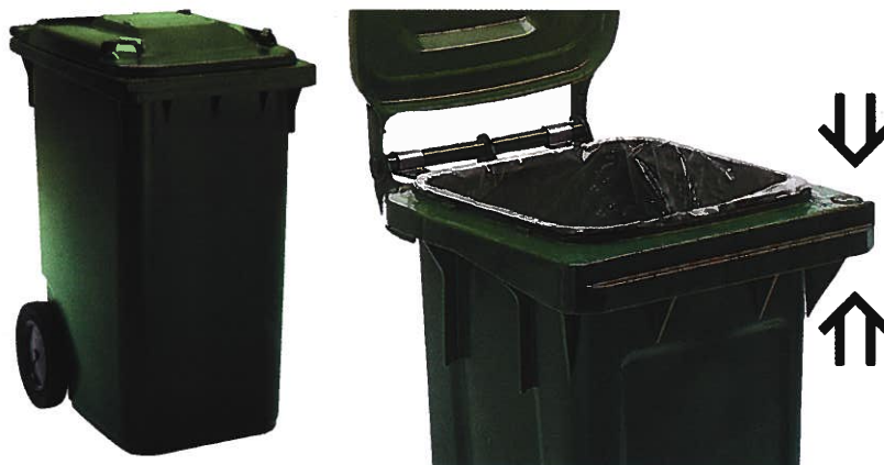
Rys. 2. Typowy pojemnik na odpady komunalne. Pojemniki tego typu posiadają odpowiednią konstrukcję zaczepu, są dostosowane do odbioru mechanicznego oraz wytrzymałe, gwarantując wieloletnie użytkowanie bez utraty walorów funkcjonalnych i estetycznych.

POJEMNIK DO SELEKTYWNEJ ZBIÓRKI ODPADÓW KOMUNALNYCH zapewnia właściciel nieruchomości (kupno lub dzierżawa):