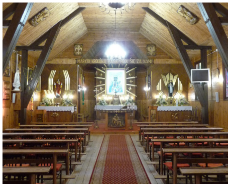
Kościół w Kopisku