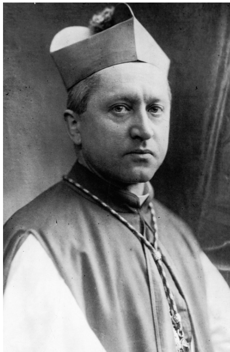
Prymas August Hlond

Dobrzyniewska parafia witała Prymasa Polski bardzo uroczyście i wspólnie, że Jego Eminencja był zadowolony. Bo kiedy parafie, przez które przejeżdżał Jego Eminencja obok kościołów, jak Knyszyn, Downary i Mońki zupełnie nie wyszły powitać Jego Eminencji, to parafia Dobrzyniewska na czele ze swo-