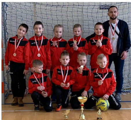
Drużyna żaków na turnieju w Brańsku