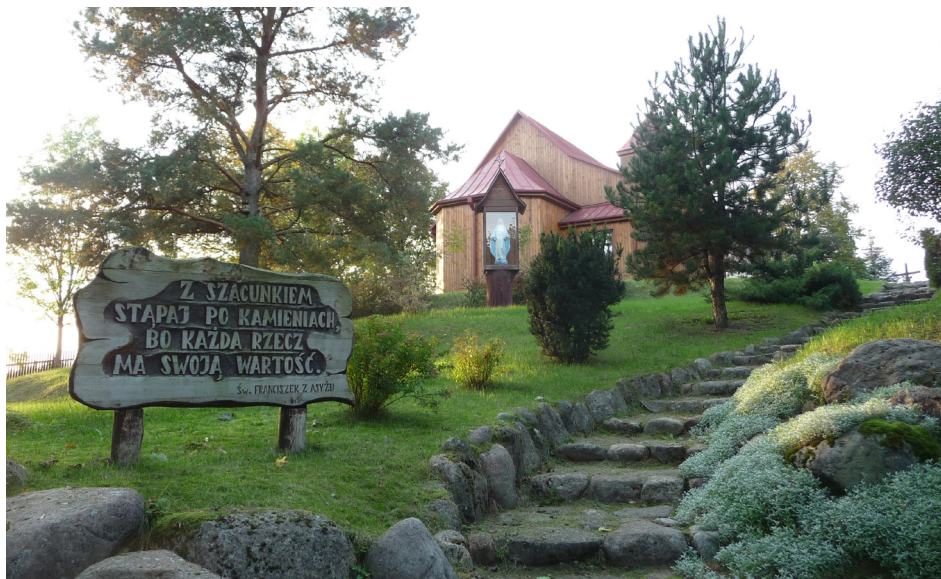
Ogród przykościelny w Kopysku

Na początku to zaangażowanie było znikome, minimalne. Z czasem jednak coraz więcej osób włączało się w prace porządkowe, wykazywało troskę o wystrój terenu przykościelnego. Ten trend ciągle się utrzymuje, a nawet się rozwija. Przykład? Nie tak dawno z inicjatywy pana organisty został utworzony chór męski, który przygotowuje oprawę muzyczną niektórych mszy św., zorganizował koncert kolęd, koncert z okazji imienin proboszcza. W planach mamy założenie scholi dziecięcej. Zaangażowanie społeczne parafian ujmują kroniki — 5 grubych tomów zawiera m.in. zdjęcia oraz notatki z odbytych uroczystości, wizyt pielgrzymów, prac społecznych na rzecz parafii.