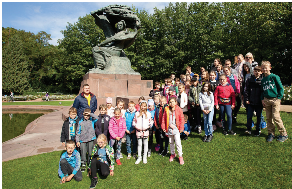
Uczniowie z SP w Obrubnikach wygrali wycieczkę do Warszawy