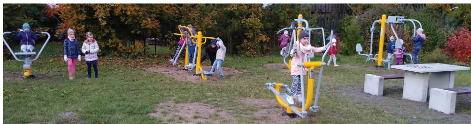
Dzieci cieszą się z nowej siłowni pod chmurką w Obrubnikach