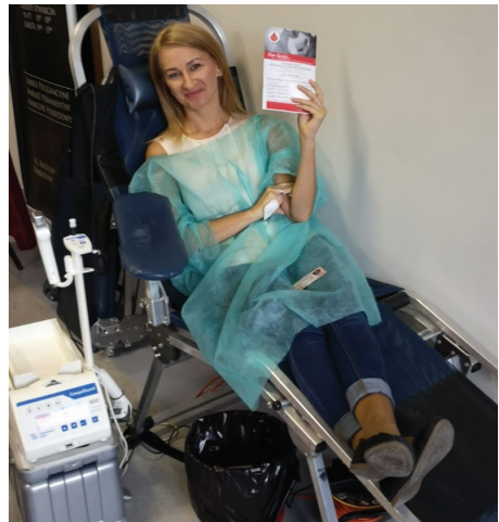
Stowarzyszenie cyklicznie organizuje zbiórkę krwi w przychodni w Dobrzyniewie Fabrycznym

Na łamach tego czasopisma chcielibyśmy bardzo podziękować za wspar-