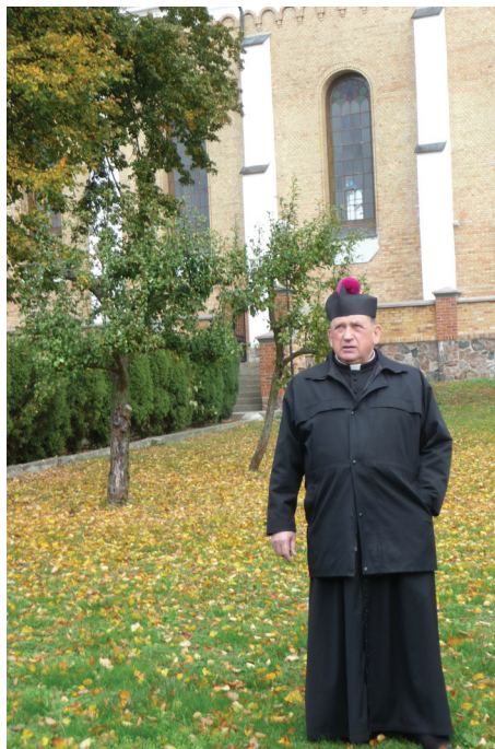
Piękna przyroda, zabytkowa świątynia – to atuty pracy w Dobrzyniewie – uważa duszpasterz.