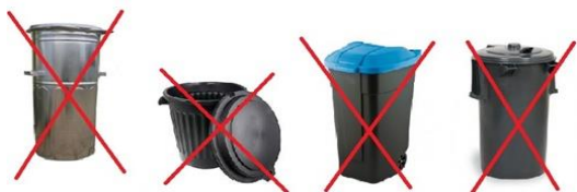
Rys. 1. Przykładowe pojemniki, które nie nadają się do odbioru odpadów komunalnych i nie spełniają wymagań polskich norm.

Rys. 2. Typowy pojemnik na odpady komunalne. Pojemniki tego typu posiadają odpowiednią konstrukcję zaczepu, są dostosowane do odbioru mechanicznego oraz wytrzymałe, gwarantując wieloletnie użytkowanie bez utraty walorów funkcjonalnych i estetycznych.